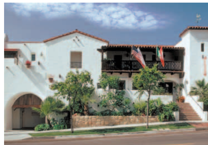
Un hotel de lujo en un pequeño oasis colorista y colonial

Santa Bárbara es una agradable ciudad de cien mil habitantes situada en la llamada Riviera californiana, a apenas una hora y media de Los Angeles, de tal modo que son muchos los residentes de esta gran ciudad que se escapan los fines de semana para disfrutar de sus magníficas playas de arena fina, pero también del encanto de su centro comercial o de su barrio español. Y dos veces al año acuden miles de personas, durante la temporada migratoria de las ballenas. Precisamente en el distrito colonial de Presidio, a un kilómetro de la costa, se hallan los vestigios de la misión fundada por el franciscano mallorquín Fray Junípero Serra, a finales del XVIII.